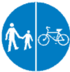
Proponowany znak nakazu