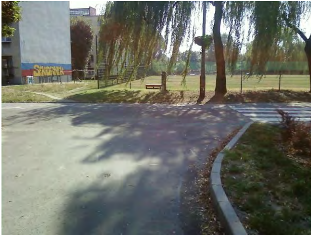
Widok od strony ul. Derkacza