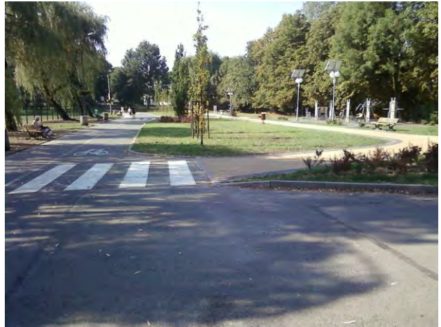
Widok od strony ul. Sikornik, po prawej ul. Derkacza