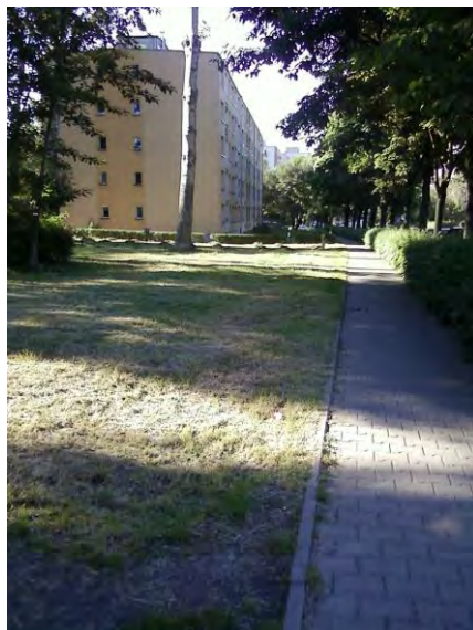
5) chodnik wzdłuż ul. Biegusa