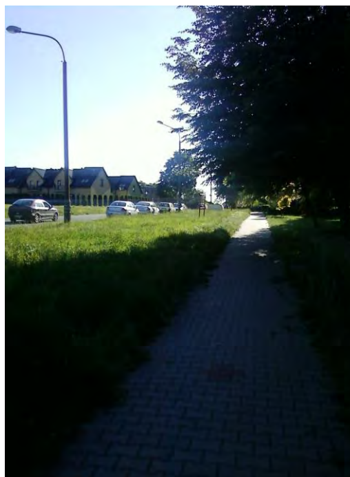
6) na przystanku głównym przy ul. Czapli